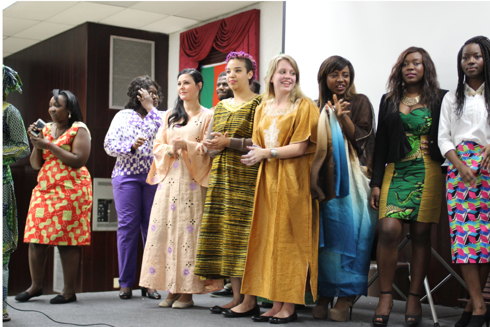
(參加非洲文化派對)