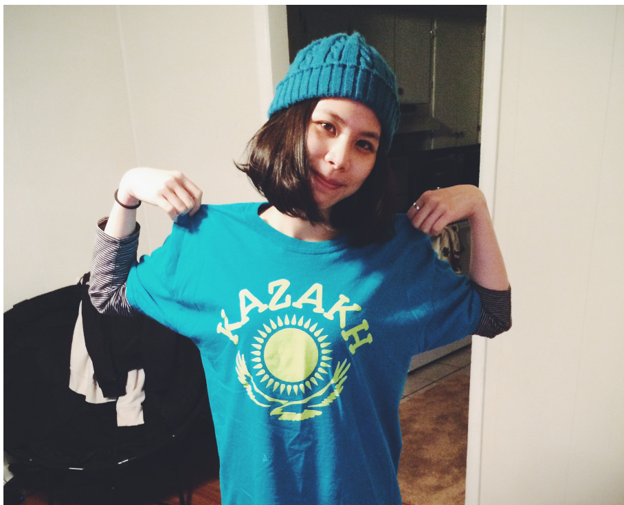
(參加哈薩克斯坦文化活動)