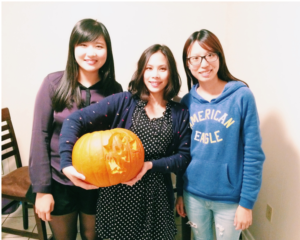
(第一次萬聖節自己刻南瓜)