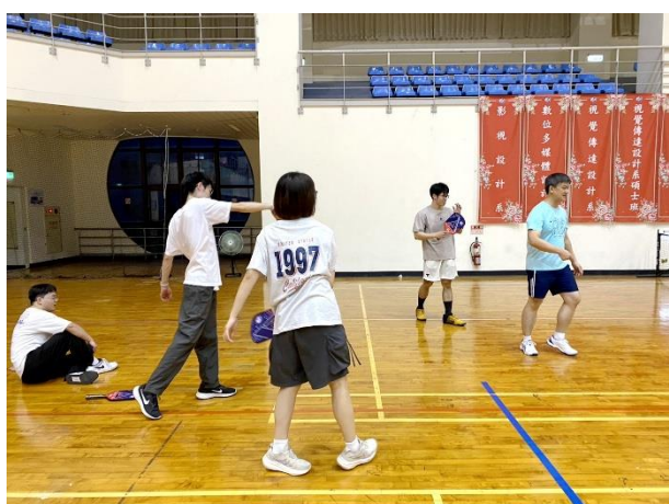
照片說明 5：教職員進行匹克球教學之 4