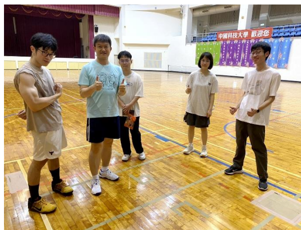
照片說明 2：教職員進行匹克球教學之 1