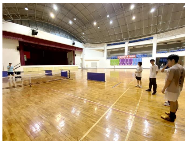
照片說明 4：教職員進行匹克球教學之 3