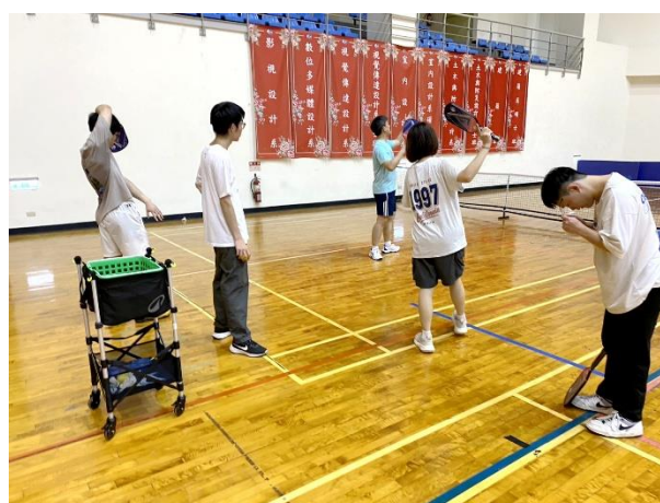
照片說明 6：教職員進行匹克球教學之 5