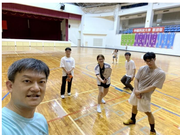
照片說明 1：所有參與匹克球運動之師生