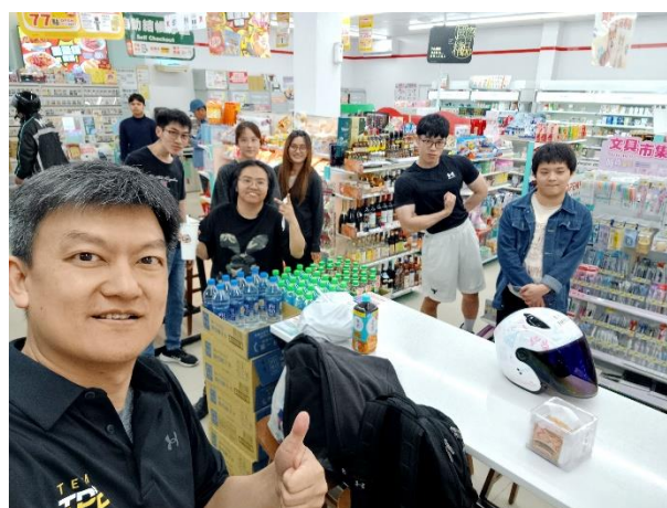
照片說明 6：活動結束後至喝飲品獎勵