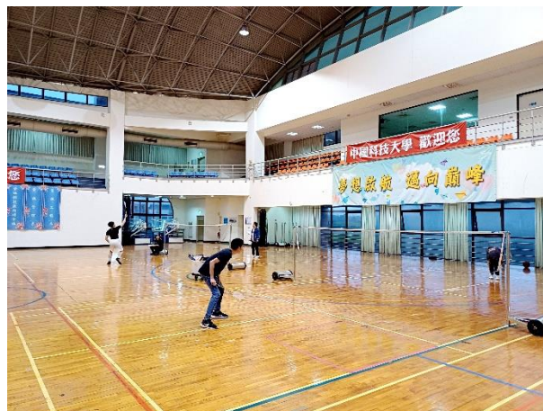
照片說明 4：適應體育羽毛球比賽之 2