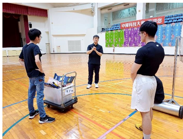
照片說明 2：適應體育羽毛球分組比賽說明之 2