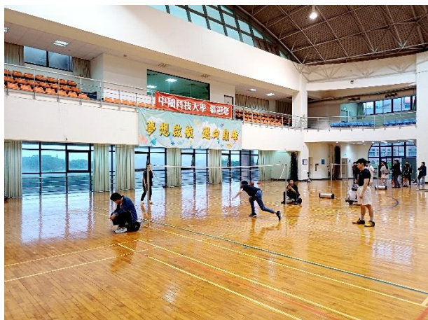
照片說明 3：適應體育羽毛球分組比賽之 1