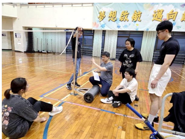
照片說明 1：適應體育羽毛球分組比賽說明之 1