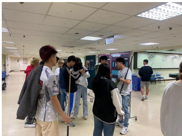
照片說明 3：參加選手報到