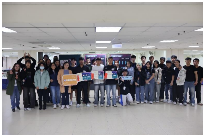
照片說明 1：全體選手與師長合影