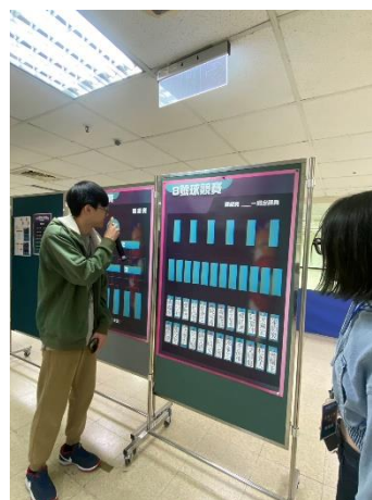
照片說明 6：參賽選手賽程表