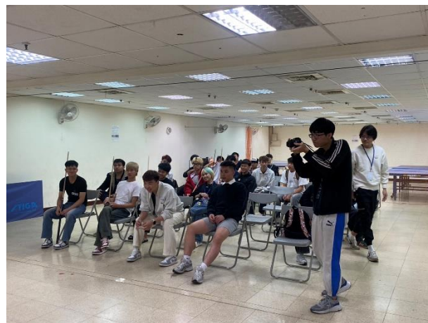
照片說明 4：參加選手集合