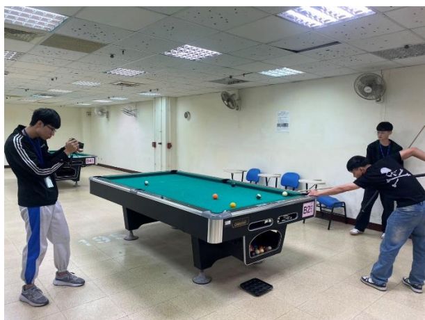
照片說明 5：選手比賽照片