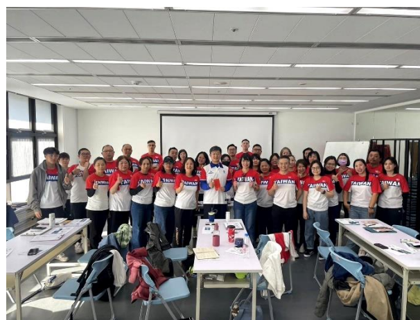
照片說明 6：全體教練、教師合影