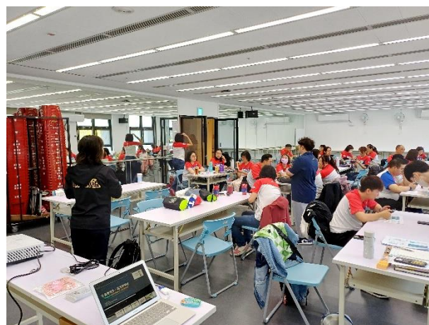
照片說明 2：上課參與之教練與講師群之 1