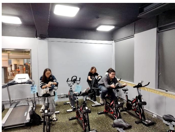
照片說明 3：飛輪虛擬情境比賽現況之 1