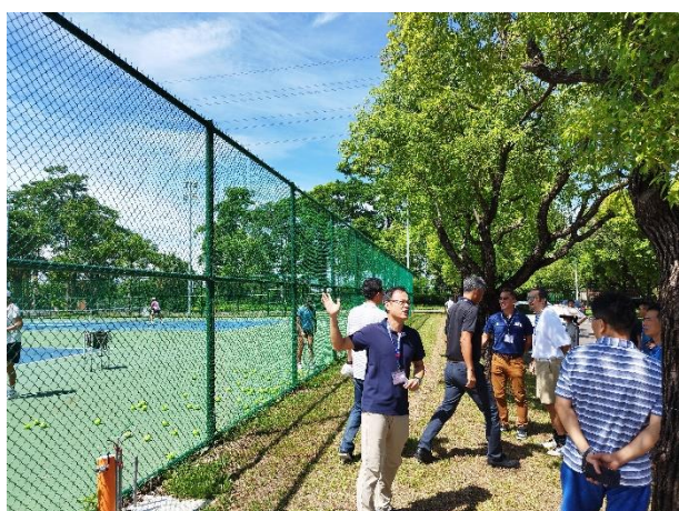
照片說明 5：大專校院體育主管業務研討會之 5