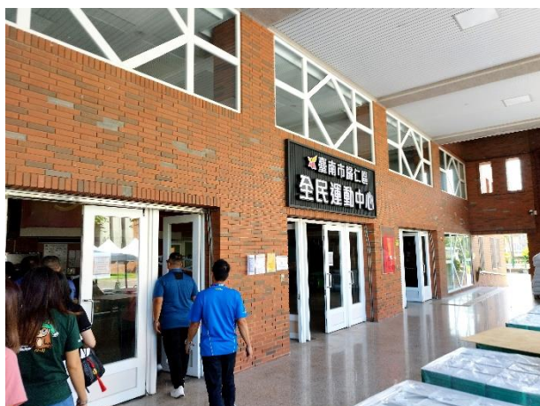
照片說明 3：大專校院體育主管業務研討會之 3