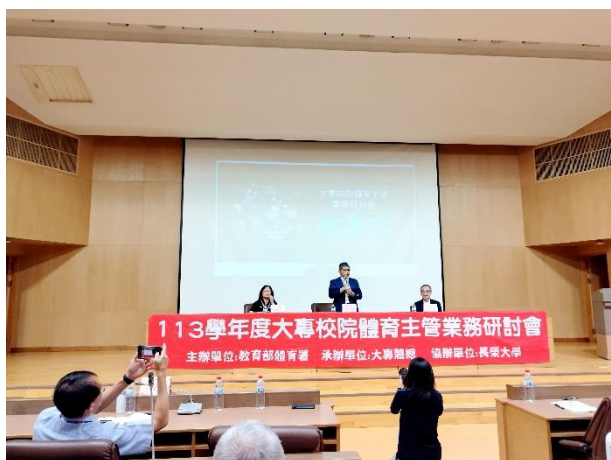
照片說明 1：大專校院體育主管業務研討會之 1