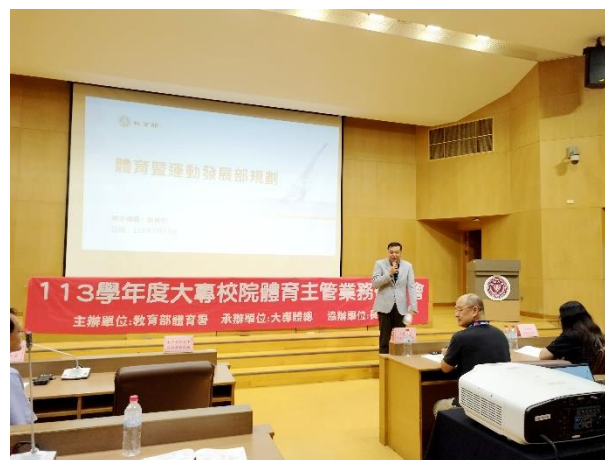
照片說明 2：大專校院體育主管業務研討會之 2