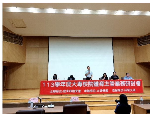
照片說明 6：大專校院體育主管業務研討會之 6