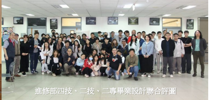
進修部四技、二技、二專畢業設計聯合評圖