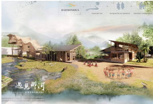
2022金點新秀設計獎空間設計類 楊淳媛 周鼎尊