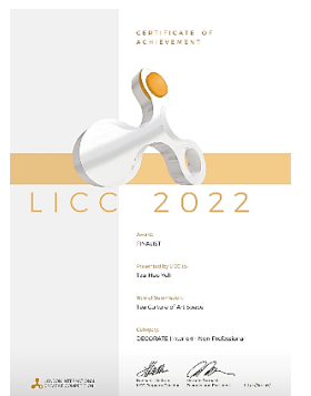
2022 LICC 葉子豪